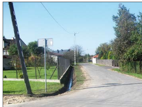
Skotniki – ul. Por. Emira

instalacji elektrycznej na miedzianą, wykonanie zewnętrznych schodów ewakuacyjnych oraz montaż hydrantu p. poż., remont bieżni ze skoczną do skoku w dal.