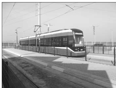
Pętla tramwajowa Czerwone Maki