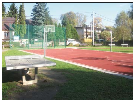
Tyniec – boisko przy ul. Dziewiarzy