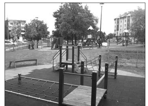
„Smoczy skwer” przy ul. Zachodniej