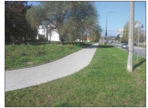
Ruczaj – chodnik przy ul. Rostworowskiego