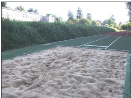
Sidzina – bieżnia ze skoczną do skoku w dal SP Nr 133