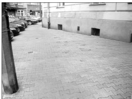
Dębni – chodnik przy ul. Madalińskiego

Przedszkole Nr 133 f – remont ogrodzenia i tarasów, remont łazienek, remont tynków od strony tarasów i wymiana rynien, remont dachu.