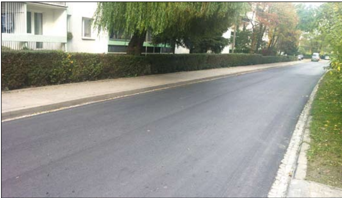
Os. Podwawelskie – ul. Słomiana

tacji projektowej, wymiana okna na okno służące do oddymiania klatki schodowej.