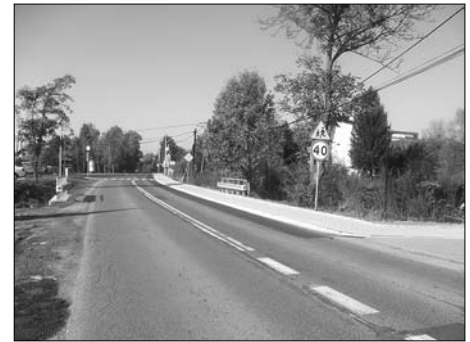
Kostrze – chodnik przy ul. Tynieckiej

Szkół Ogólnokształcących Integracyjnych Nr 2, budowę „Smoczego Skweru” przy ul. Zachodniej, budowę placów zabaw w ramach programu „Radosna Szkoła”, budowę boiska przy Gimnazjum Nr 22 i budowane w chwili obecnej boisko przy Zespole Szkolno-Przedszkolnym Nr 7.