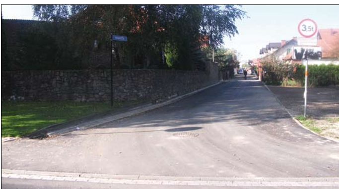
Pychowice – ul. Na Leszczu

Chodniki i ulice: ul. Pszczelna – parking przy SP 40, ul. Kobierzyńska od ul. Torfowej w kierunku ul. Gwieździstej, ul. Rostworowskiego, ul. Kobierzyńska 58/60, ul. Kobierzyńska od ul. Torfowej w kierunku ul. Lubostroń, ul. Kobierzyńska 60, budowa ul. Chmieleniec – opracowanie koncepcji, ul. Liściasta, ul. Kwiecista, ul. Drozdowskich, ul. Zalesie, ul. Łany.