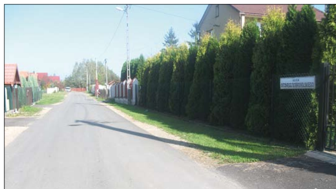
Skotniki – ul. Dobrowolskiego

Przewodniczący Rady i Zarządu Dzielnicy VIII Dębniki