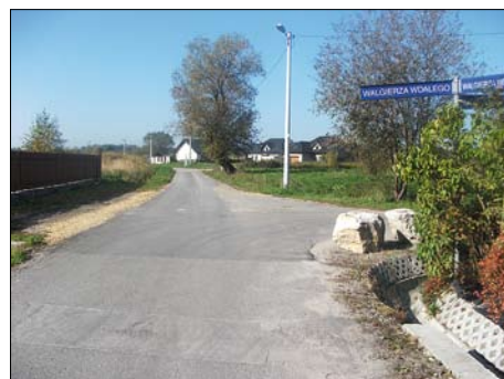
Tyniec – ul. Walgierza Wdałego