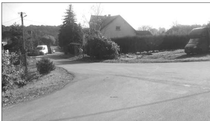
Bodzów – ul. Nierówna

Ogródki jordanowskie: ul. Dąbrowa – doposażenie.