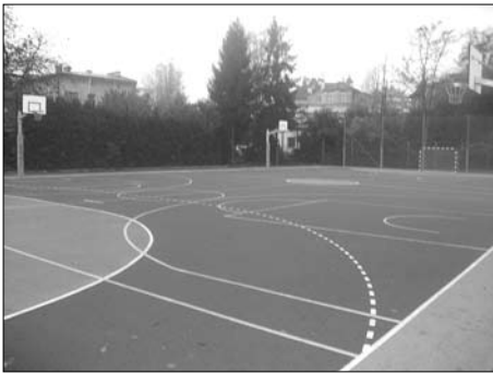
Boisko przy Gimnazjum Nr 22