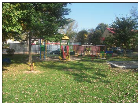
Tyniec – plac zabaw przy ul. Dziewiarzy

Ogródki jordanowskie: ogródek przy ul. Dziewiarzy – prze-niesienie oraz doposażenie, modernizacja boiska przy ul. Dzie-wiarzy wraz z wykonaniem skoczni w dal.