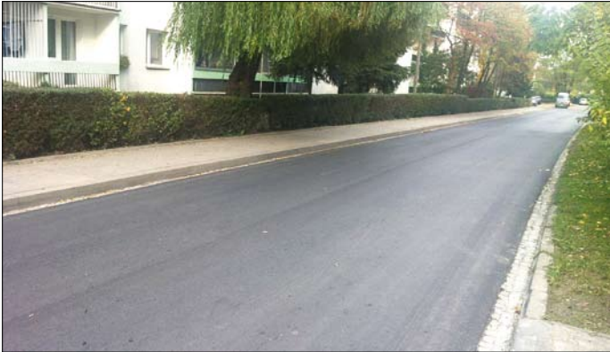
Os. Podwawelskie – ul. Słomiana

tacji projektowej, wymiana okna na okno służące do oddymiania klatki schodowej.