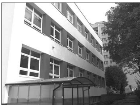
Termomodernizacja Gimnazjum Nr 21