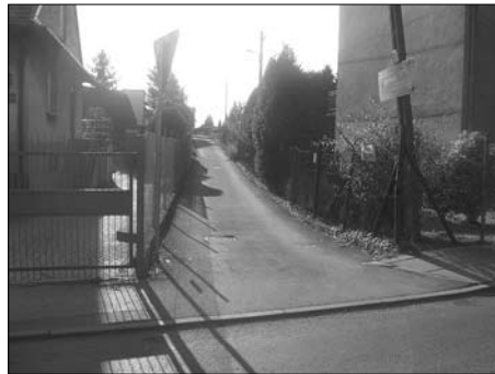
Psychowice – ul. Rodzenna