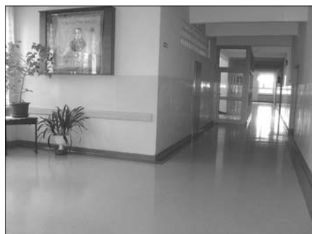
Dębni – nowy korytarz w Gimnazjum Nr 22