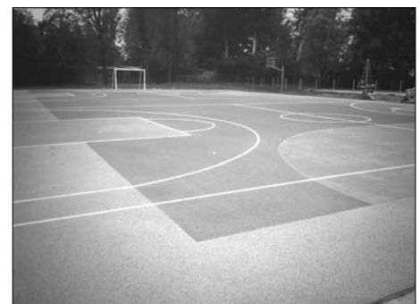
Os. Podwawelskie – boisko SP Nr 25