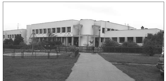
Termomodernizacja Zespołu Szkół Ogólnokształcących Integracyjnych Nr 2

Dzięki owocnej współpracy z Prezydentem Miasta Krakowa, radnymi Miasta Krakowa oraz jednostkami miejskimi udało się zrealizować wiele inwestycji, które przekraczały możliwości finansowe Rady Dzielnicy, m.in. termomodernizację budynków Szkoły Podstawowej Nr 25 i Gimnazjum Nr 21 oraz Zespołu