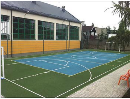
Pychowice – boisko SP Nr 62