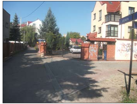
Ruczaj – ul. Liściasta