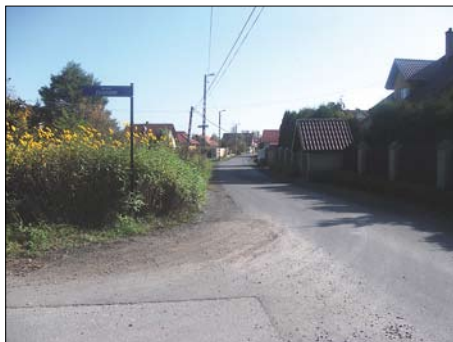
Sidzina – ul. Topografów