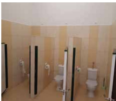
fol. z archiwum ZSP nr 7