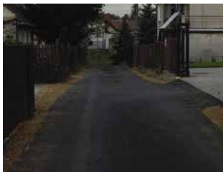
fol. Sławomir Siekacz