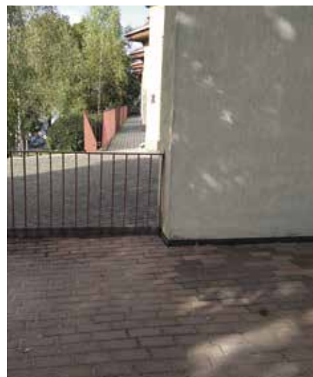
fol. Elżbieta Pytlarz