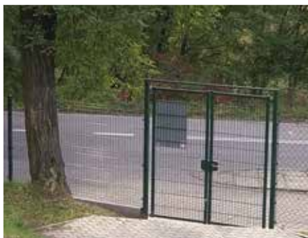
fol. Elżbieta Pytlarz