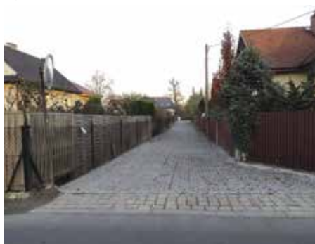
fol. Łukasz Balon