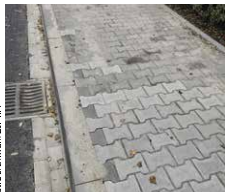
fol. Beata Augustyniak