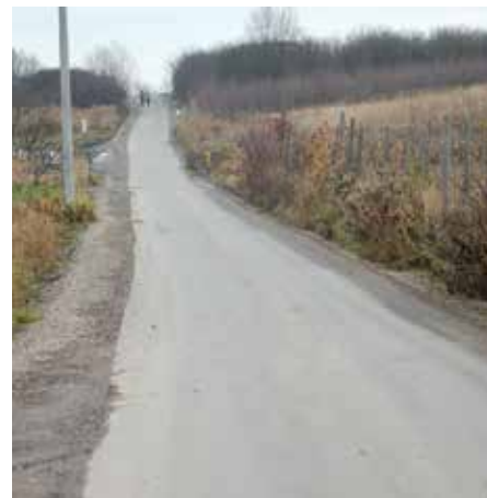
ul. Ks. Trockiego – nakładka