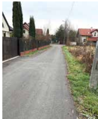
ul. Heligundy sięgacz – nakładka