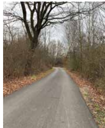
ul. Nad Czerną – nakładka

Nadszedł grudzień, a wraz z nim czas na podsumowanie realizacji kolejnych zadań finansowanych ze środków wydzielonych do dyspozycji Dzielnicy VIII Dębniki na rok 2019. Każdego roku największe środki przeznaczone są na poprawę infrastruktury drogowej oraz prace związane z remontami placówek oświatowych oraz modernizacją terenów zielonych.