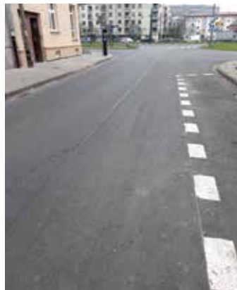
ul. Skwerowa – nakładka, fot. Beata Augustyniak