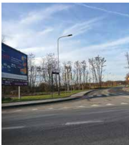
ul. Kolna – budowa