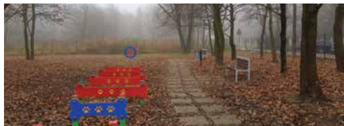
fol. Piotr Rusocki