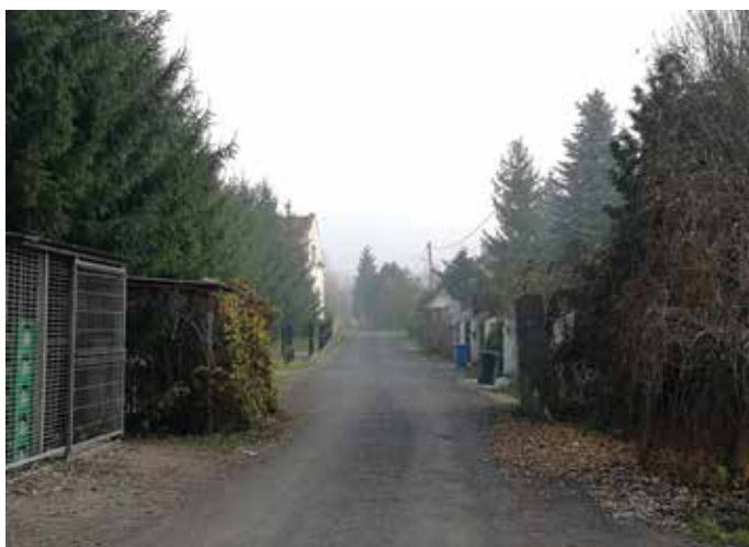
ul. Jachimeckiego – skropienie