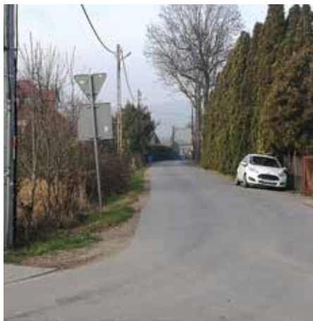
ul. Krzewowa – nakładka, fot. Łukasz Balon