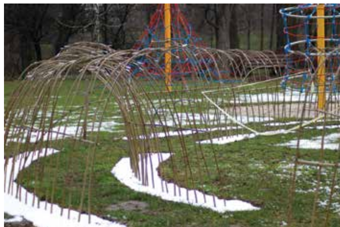
tunele z żywej wierzby na terenie ogródka jordanowskiego przy ul. Kozienickiej