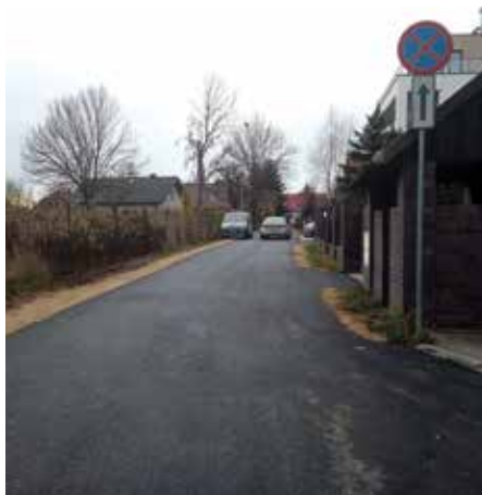
ul. Wiśniewskiego – nakładka