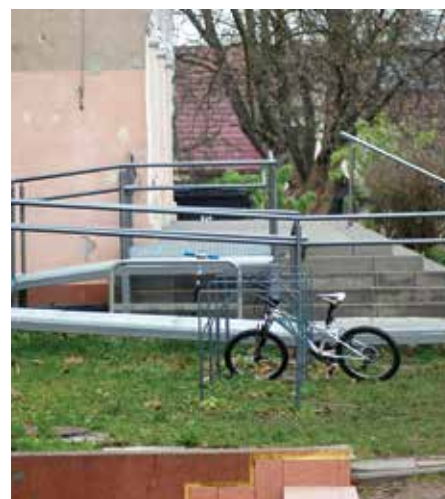
remont schodów wraz z wykonaniem podjazdu dla osób niepełnosprawnych przy wejściu głównym w ZSP 7