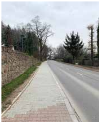
ul. Bolesława Śmiałego – remont chodnika