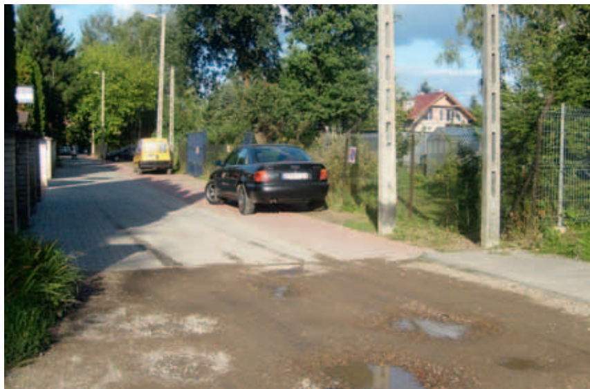
Łany do remontu.