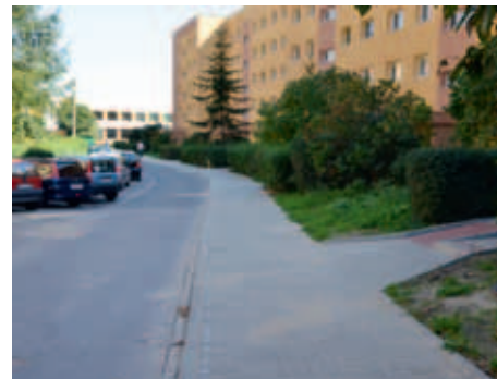
ul. Kobierzyńska 60