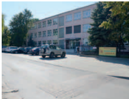
ul. Pszczelna 40