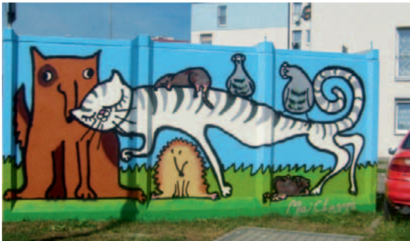
Mural „Przyjaciele” – zwycięski projekt w konkursie „Ósemka w sprayu” – 2012. Autorka: Katarzyna Czerniawska z Domu Kultury „Podgórze”

Współorganizatorami konkursu są: Dom Kultury „Podgórze”, Straż Miejska Miasta Krakowa, Stowarzyszenie „Siemacha”, Zarząd Infrastruktury Sportowej oraz Zarząd Budynków Komunalnych.