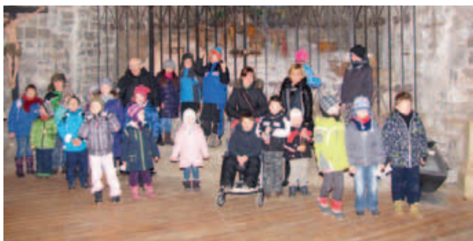
Wycieczka do kopalni soli w Bochni

Tak. Odbyło się fantastyczne spotkanie w SCANI na Tynieckiej, gdzie główną atrakcją była przejażdżka tirem. Mikołaj też był fantastyczny u strażaków na ul. Rzemieślniczej. Dzieci wiedziały, że jedziemy oglądać wozy strażackie, gdzie po małym poczęstunku i obejrzeniu wszystkich aut, remizy i akcesoriów strażackich, niespodziewanie okazało się, że na dachu jest Mikołaj z prezentami i strażacy musieli go ściągnąć z tego dachu. Radości nie było końca. Bardzo miło było później dostać telefon od mamy, która mówi, że dziecko jeszcze przez następny tydzień żyło wrażeniami związanymi z Mikołajem na dachu. W końcu nie każdy ma taką możliwość zobaczyć Mikołaja na własne oczy, który na dodatek potrzebuje strażaków do pomocy