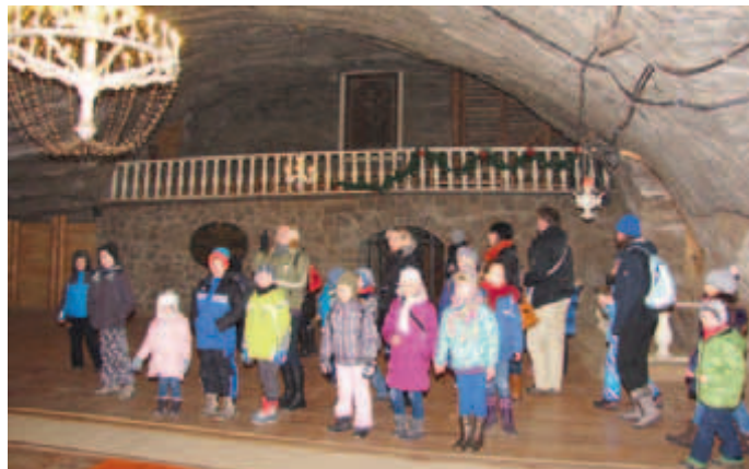
Wycieczka do kopalni soli w Bochni

przy zejściu na dół. Jakby tego było mało, to Mikołaj zostawił jeszcze prezenty w SCANI i u ich sąsiadów, w firmie Adler.